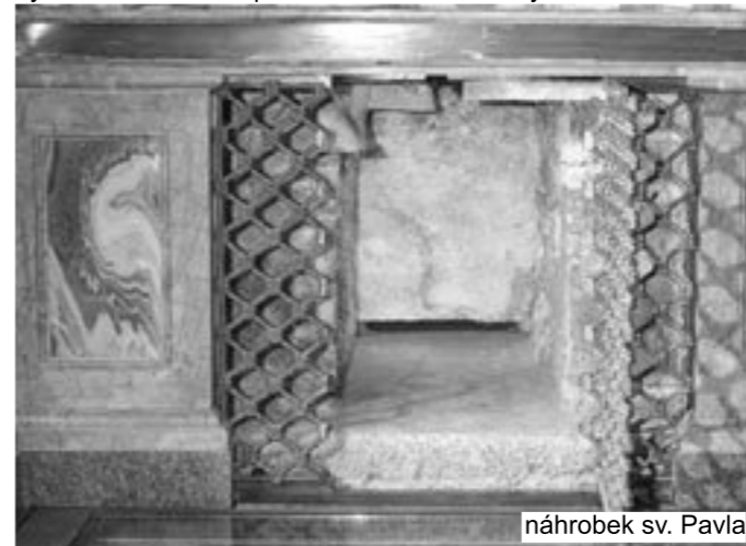
náhrobek sv. Pavla

Jak dále uvedl, Rok svatého Pavla bude výsadním způsobem probíhat v Římě. V papežské bazilice, ve které jsou uchovány relikvie světce, a rovněž v přilehlém benediktinském opatství, jemuž je bazilika svěřena, se při této příležitosti budou konat různá liturgická, kulturní a ekumenická setkání i další pastorační a společenské akce, inspirované pavlovskou spiritualitou. Zvláštní pozornost má být věnována také poutím věřících z různých zemí k hrobu